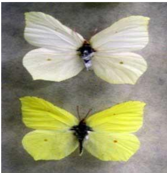
Latolistek cytrynek, listkowiec cytrynek-

to dość pospolity w Polsce motyl dzienny o pięknych żółtych skrzydłach. Kolor skrzydeł samca jest bardzo intensywny a samicy biały. Na skrzydłach wyraźnie widoczne są charakterystyczne pomarańczowe punkty. Można wyczuć lekko cytrynowy zapach skrzydeł - stąd nazwa cytrynek.